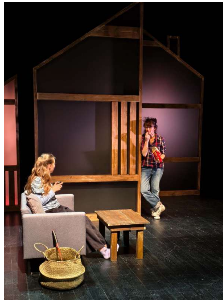
Répétitions - novembre 2025 Agence culturelle du Grand Est / Sélestat (67)