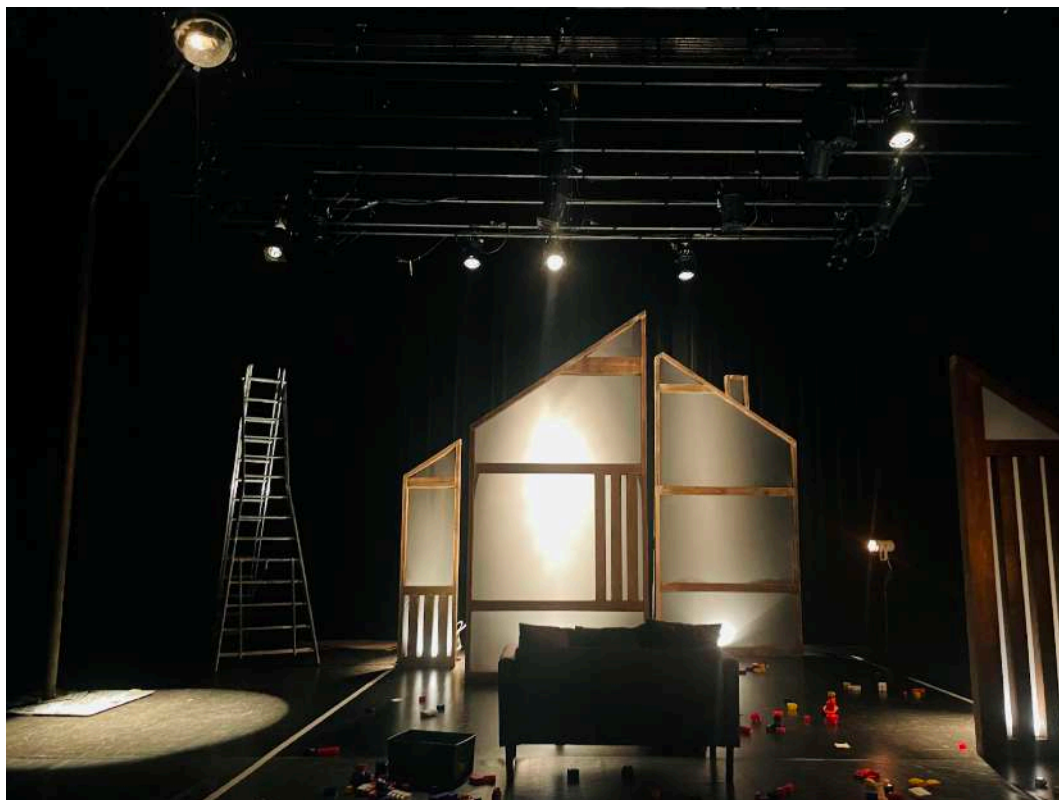
Décor en montage, plan large avec réverbère.