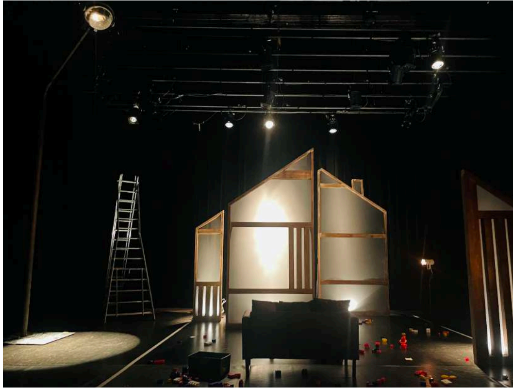
Décor en montage, plan large avec réverbère. Répétitions - novembre 2025 Agence culturelle du Grand Est / Sélestat (67)