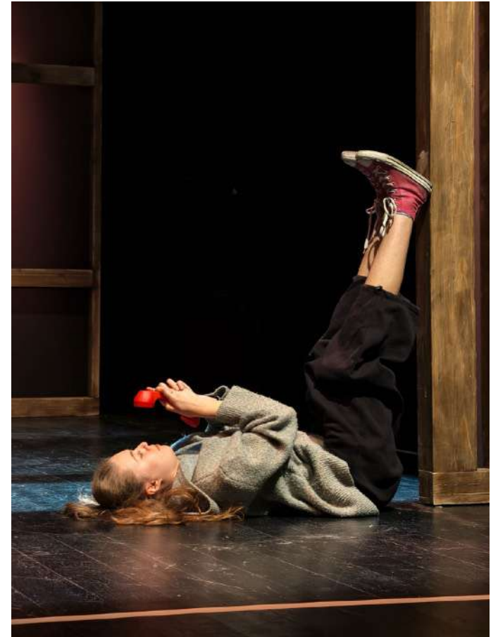
Répétitions - novembre 2025 Agence culturelle du Grand Est / Sélestat (67)