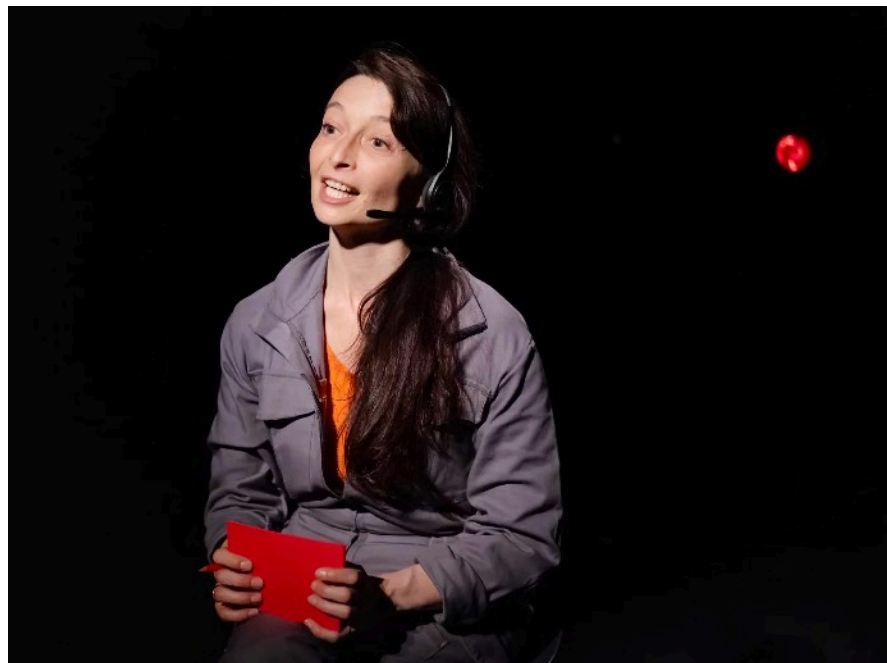
Représentation Espace Bernard-Marie Koltès Avril 2022